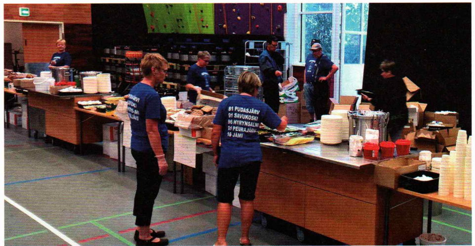
| Ruokailu mukavasti sisätiloissa.