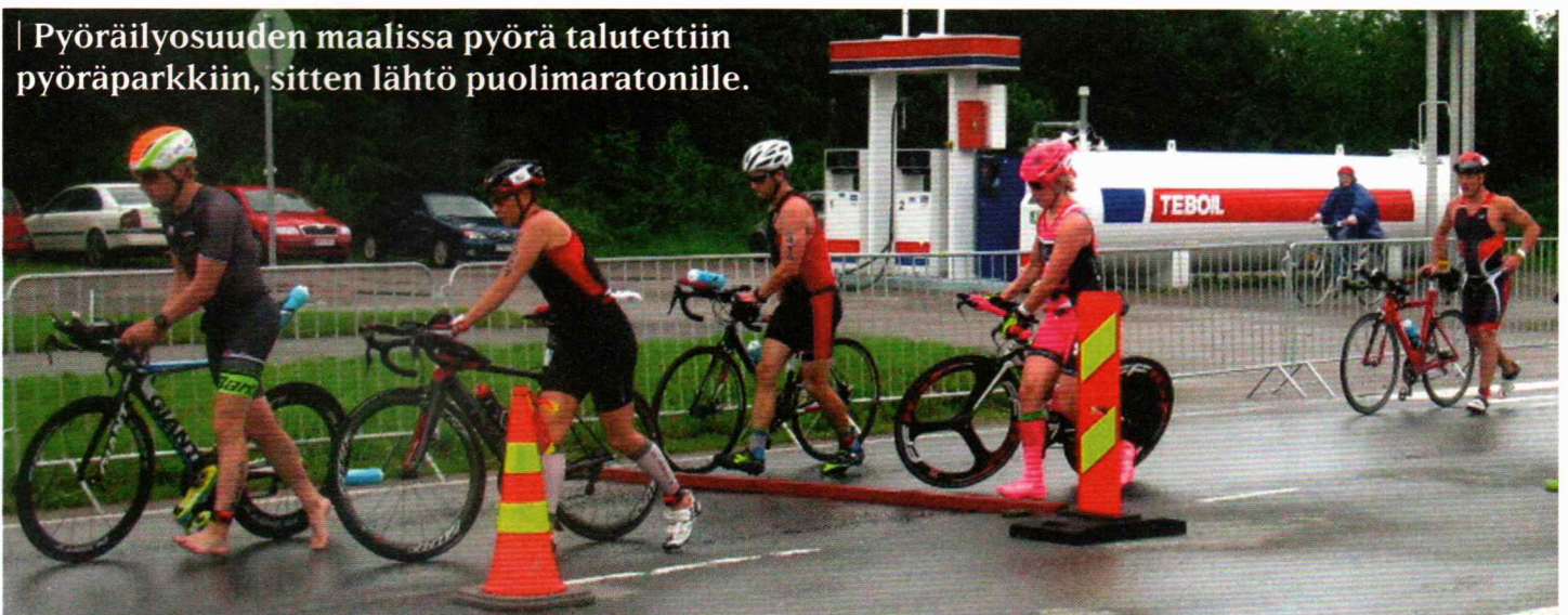
| Pyöräilyosuuden maalissa pyörä talutettiin pyöräparkkiin, sitten lähtö puolimaratonille.

Kisaa oli mielenkiintoista seurata aitiopaikalta. Yksi pyöräilijä viittoili takana istuneelle valvojalle. Löystynyt ohjaustanko aiheutti ongelmia. Valvoja antoi seuraavalle huoltopisteelle hälytyksen, jotta saatavissa olisi tietty avain-sarja. Sitten pysähdyttiin huoltopisteelle ja pyöräilijä tuli sinne hetken päästä. Avain löytyi, pyörä tuli kuntoon ja matka jatkui.