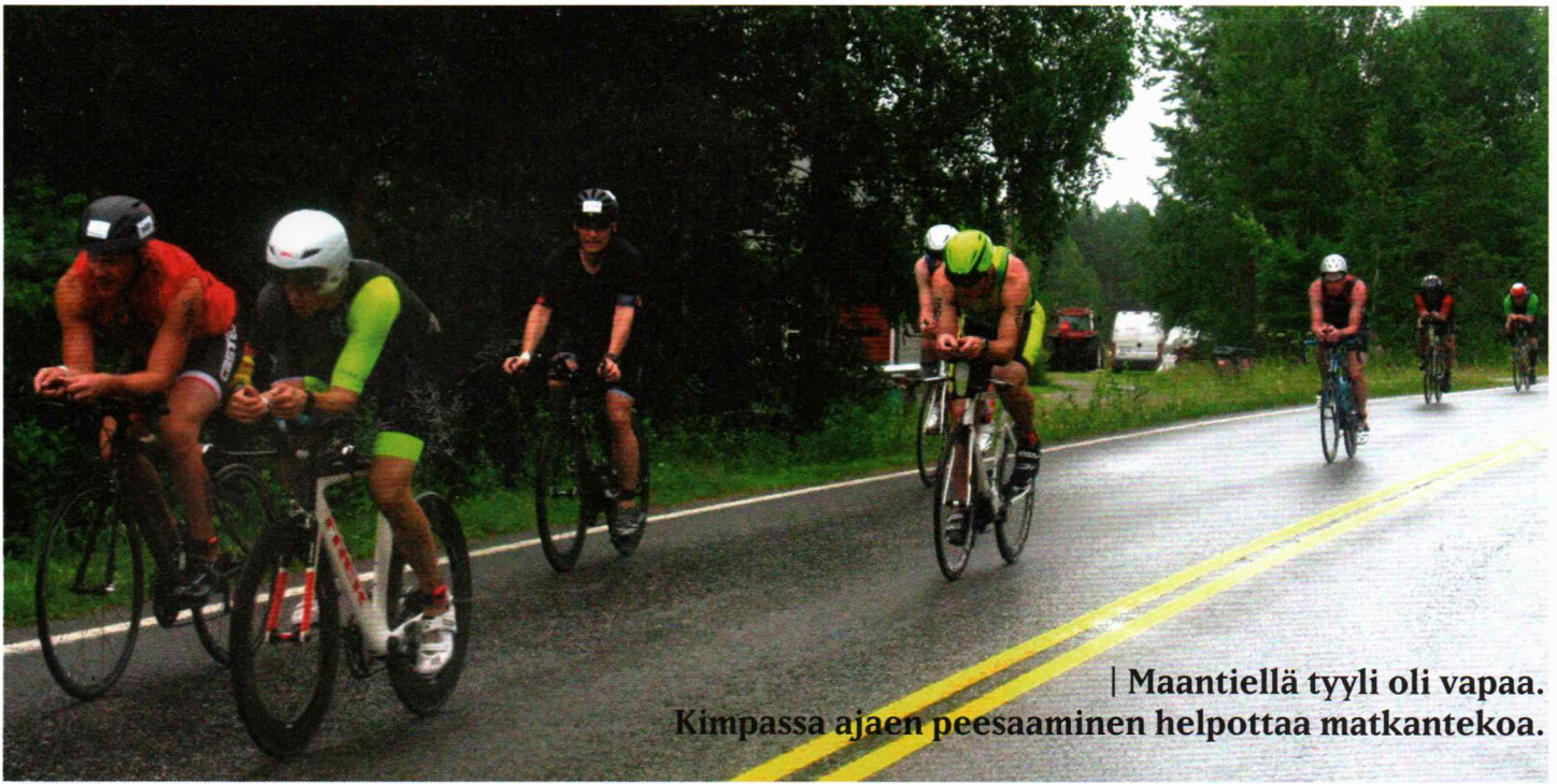
| Maantiellä tyyli oli vapaa. Kimpassa ajaen peesaaminen helpottaa matkantekoa.

Joroisissa järjestettiin Finntriathlon-tapahtuma, johon kuului myös puolikasmatkojen SM-triathlon. Sinne haettiin pyöräkuskeja kyydittämään tuomareita ja ratavalvojia pyöräilyosuudella. Tilaisuus tarjoutui niin pääsin kускаamaan ratavalvojaa. Isommat pyörät saivat kuskata myös kalustoa, erään pyörän kyytiin tuli televisiokuvaaja.