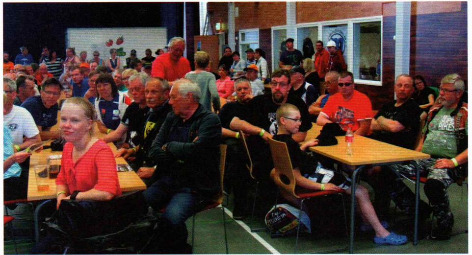
| Jämi Areenan salissa tilaa riitti.

| Kilpailulajina polkupyöräajo. Tottumukset olivat vinksallaan ohjaustangon kääntyessä päinvastoin etupyörään nähden.