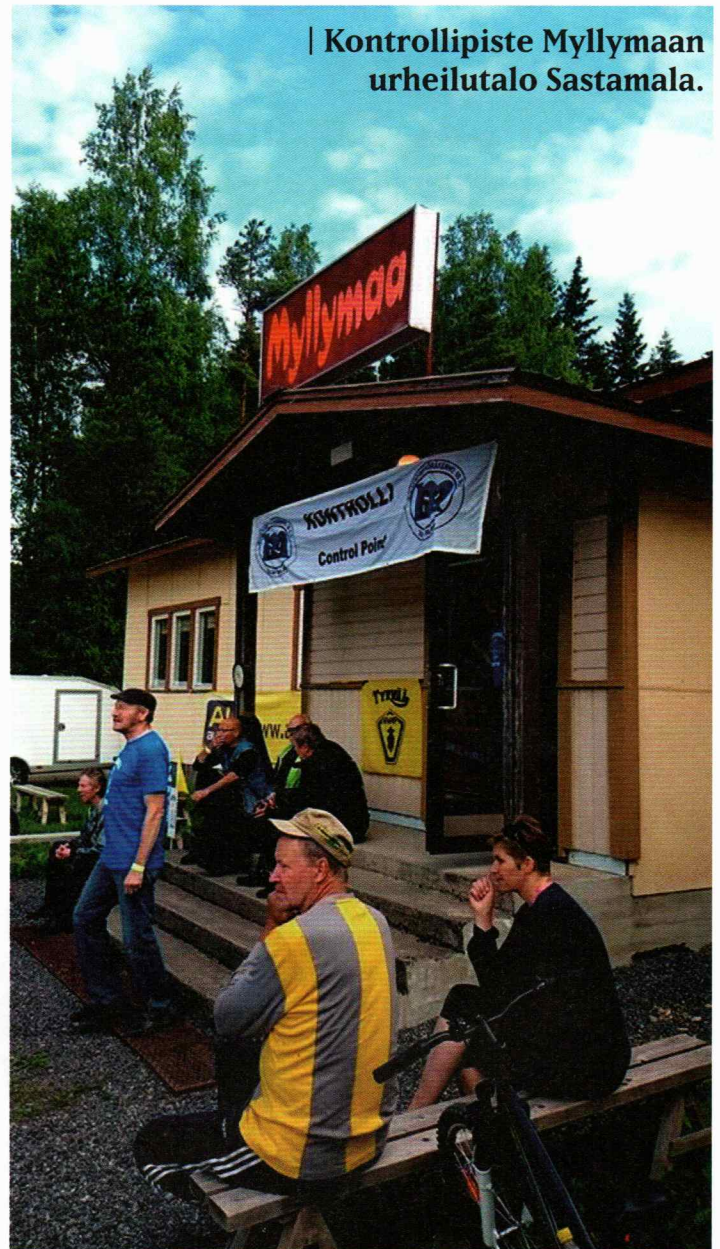
| Kontrollipiste Myllymaan urheilutalo Sastamala.

Kiitokset järjestäjille, talkoolaisille, MP 69 -kerholaisille sekä yhteistyökumppaneille. Yhdessä saimme viettää Jämijärven harjulla mieleenpainuvaa Kontion juhlarallia.