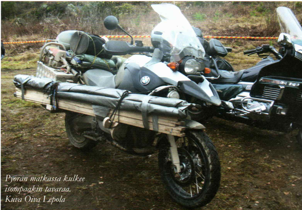
Pyörän matkassa kulkee isompaakin tavaraa.

Polttopuut ovat tärkeä osa pystymettä. Oma moottorisaha oli mukana, joten pilkkominen ei ollut ongelma. Keräsi polttopuista suurempia, niin r