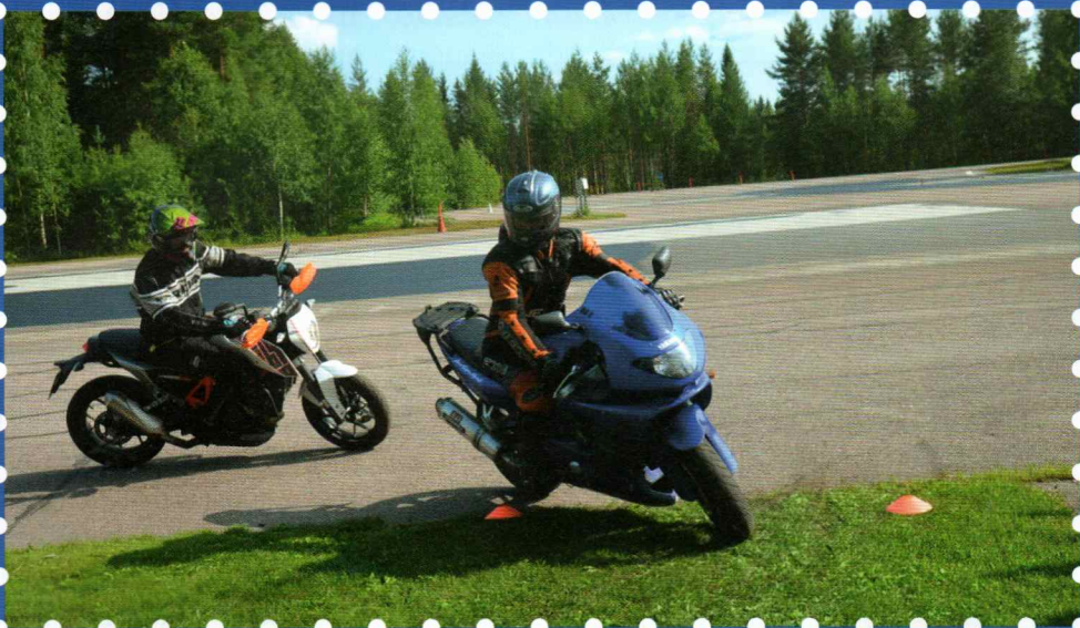
Nuorten motoristien ajotaidot joutuivat koetukselle, kun YROY-mestaruudet jaettiin elokuussa joutsassa.