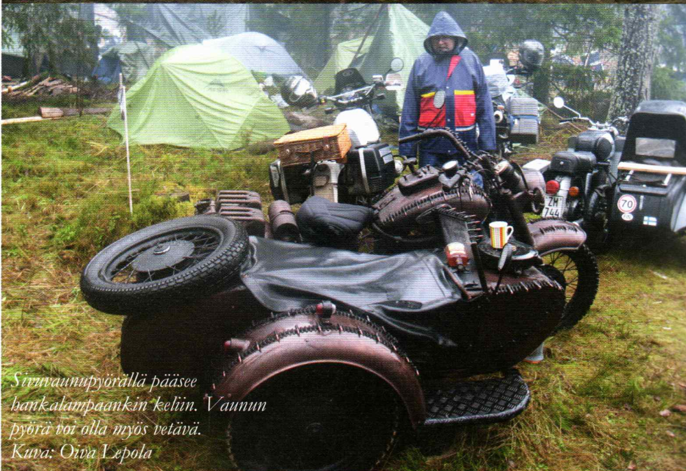
Sivuvaunupyörällä pääsee bankalampaankin keliin. Vaunun pyörä voi olla myös vetävä.