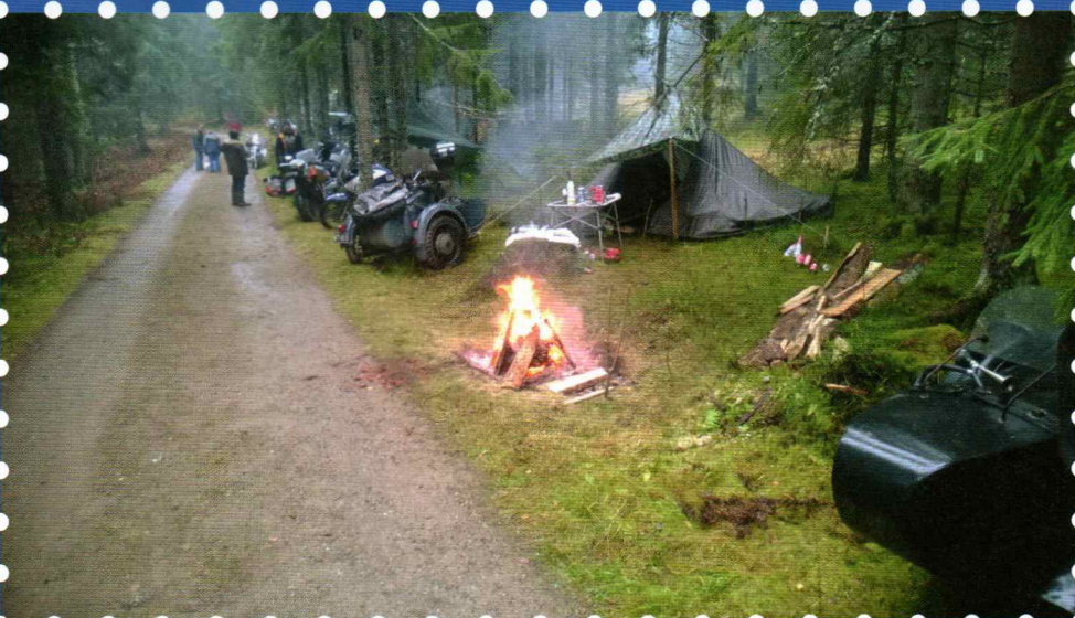
Pystymettän tunnelmia on luettavissa sivulta 12. Sääolot suosivat ja paikka oli mukava.