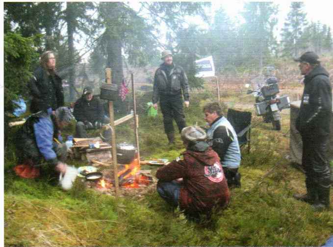
Kuvankaltaisen tunnelman saavuttamiseksi tarvitaan innokkaita talkoolaisia.

Järjestäjäporukalta vaaditaan intoa ja talkooha-