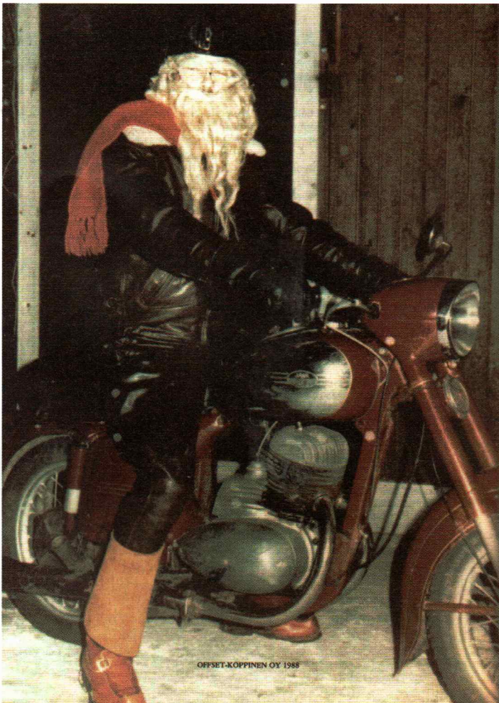
Tämän näköinen pukki ajeli Motoristissa 25 vuotta sitten.

"Kolmantena kohtana, jota en oikein kritiikiksi osaa katsoa, väitettiin, että moottoripyöräily on neuroosien purkamista, pakoa todellisuudesta. Väitteen esittäjä ei ollut itse kekeillut moottoripyöräilyn joskus ko-vaakin todellisuutta."