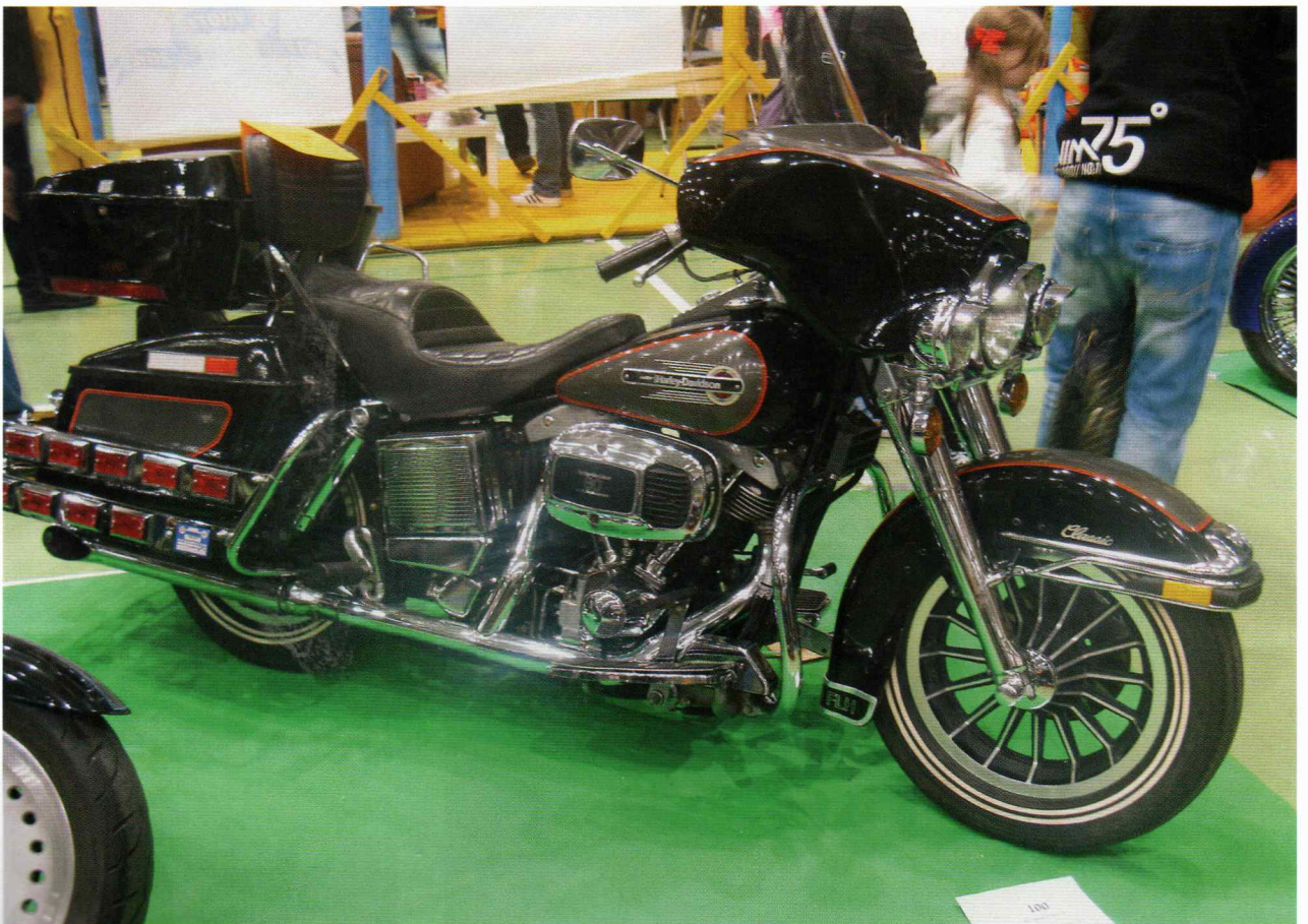
Harrikoista löytyy näin edustava matkapyörä.