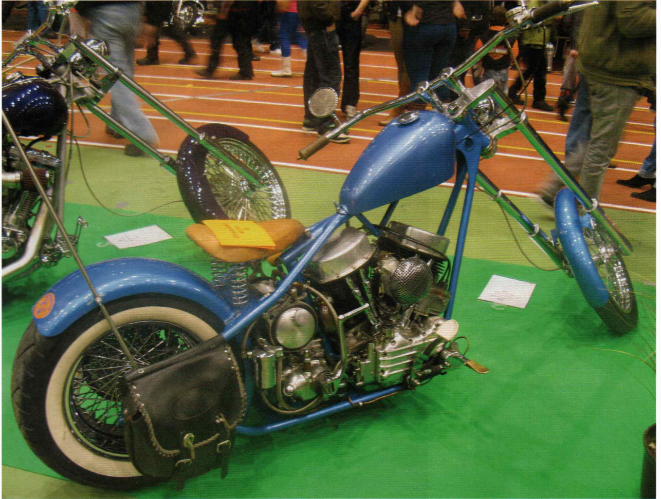
Rakennetut pyörät ovat katseenvangitsijoita ja ovat tietysti silmäteriä tekijöilleen.