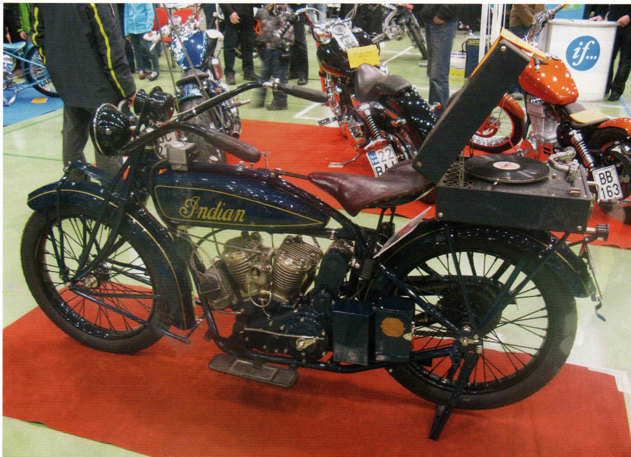
Vanha Indian pyörä on saanut takasitsilleen varusteeksi ainakin yhtä vanhan torvigrammarin. Se ei kaippaa sähköä, veivi ja pitkä vieteri riittää voimanlähteeksi.