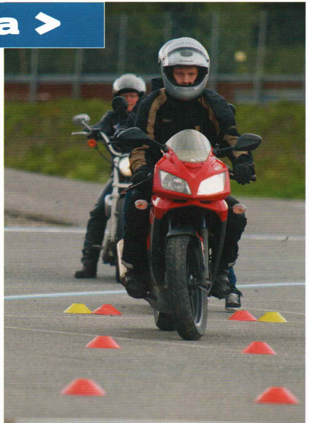
Tässä lienee Kortesuon nuorison edustaja.

Ajokauden mittaan Kerhopesällä alkaa pyöriä Nuorten illat, jonne ovat tervetulleita kaikki kerhomme nuoremman polven edustajat. Maanantainuotiot jatkuvat perinteikkäästi Siitamassa, ja sinne ovat tervetulleita kaikki innokkaat motoristit. Ajo-ohjeita saa allekirjoittaneelta sekä kouluttajilta ja muilta hallituksen jäseniltä.