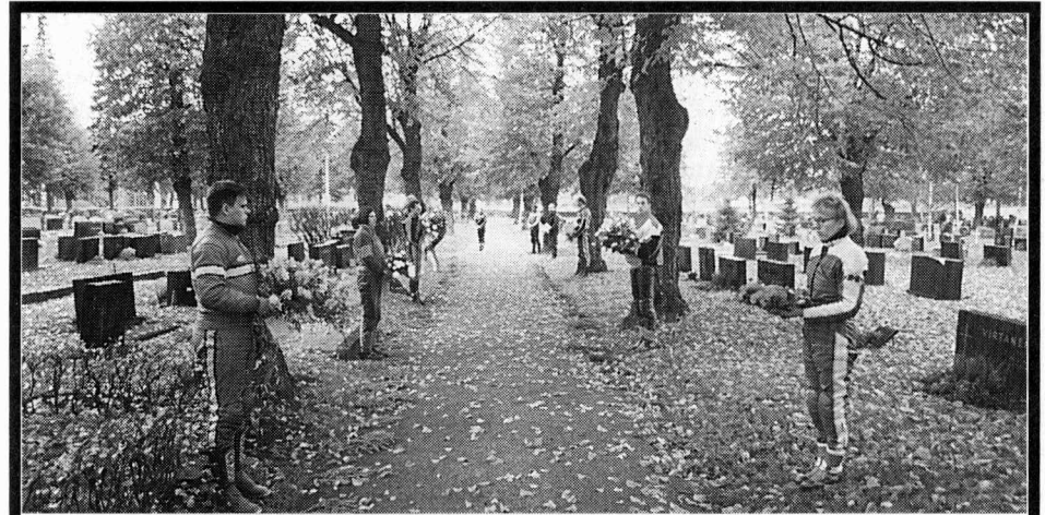
Lyyli Aalto avasi omalla toiminnallaan tietä motoristeille. Motoristit kunnoittivat toimintaa muodostamalla seppelekujan Lyyli Aallon viimeisellä matkalla.