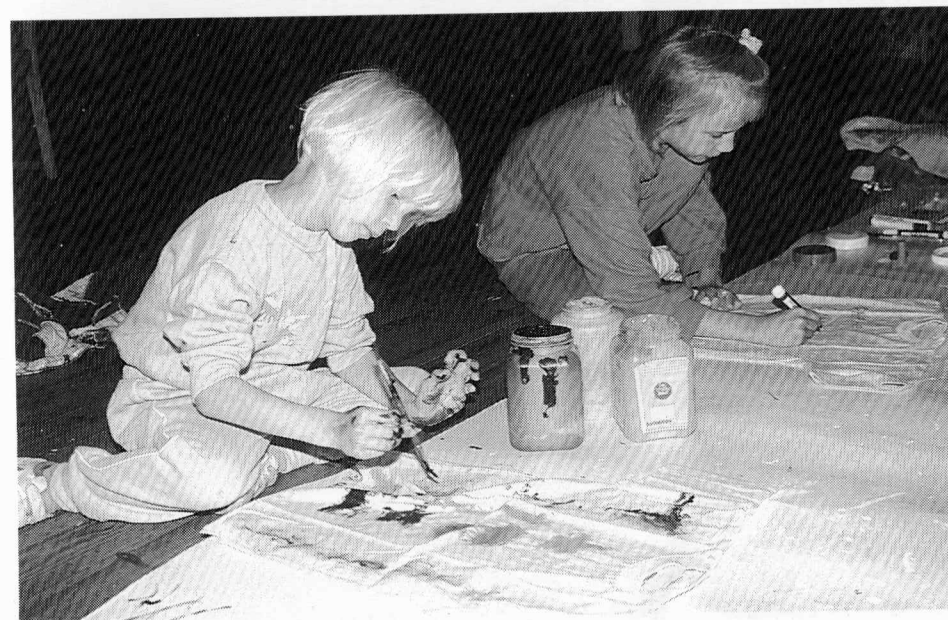
Perinteisesti lapset maalasivat itse rallipaitansa.