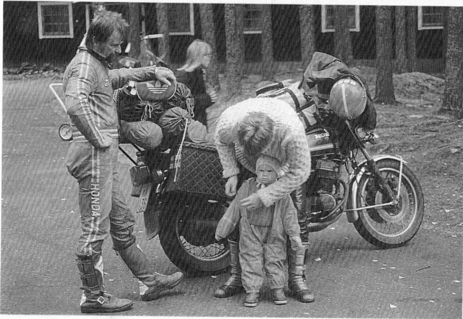
On kotiinlähdön aika, haalari päälle ja matkaan.