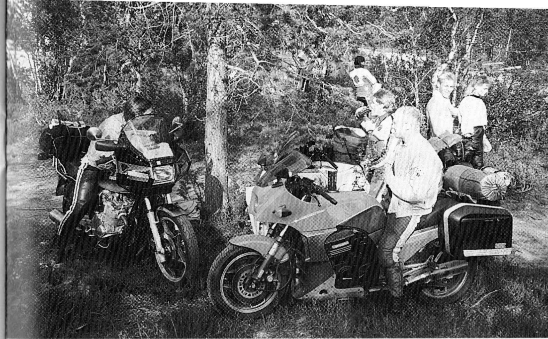
Kemijärven "mattimyöhäset" ovat vihdoin saapuneet Kontioon huiman 230 km:n ajon jälkeen.