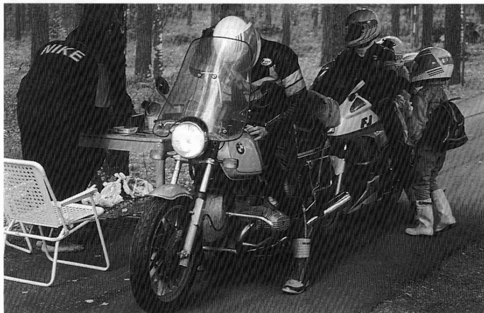
Muutama perhe tuli kahdella moottoripyörällä.