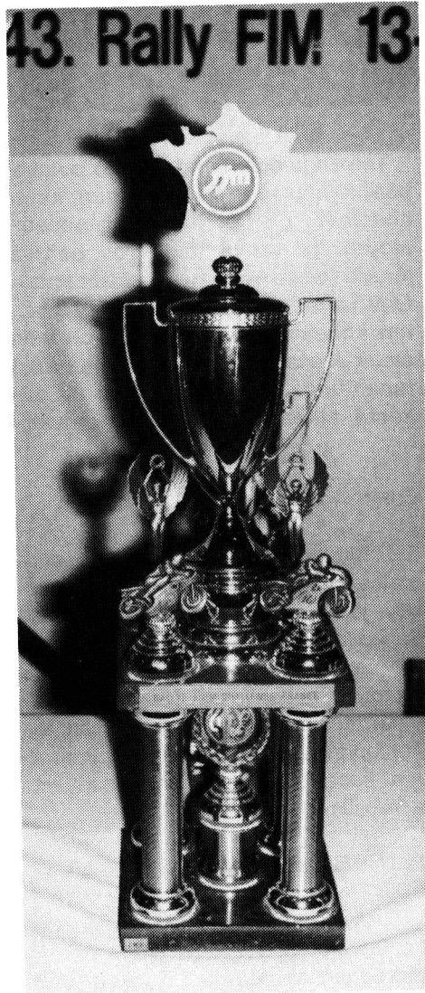
Rallye FIM Ch France

Tuollainen määrä väkeä tarvitsee melkoisen paikan kuten monasti on nähty ja kuten tiedetään, kansainvälisen tason paikkoja ei meillä kuitenkaan ole kovin monia, joten TFMK:n valinta Kuopion lähellä olevasta Rauhanlahden leirintäalueesta oli ihan nappiin osunut valinta. Koko Rauhanlahden alue hotelleineen oli varattuna motoristeille. Jotta koko kansainvälinen motoristiväki saataisiin istumaan samanaikaisesti ruokapöydän ääriin oli myös ratkaistu oivasti. Kuopion jäähalli toimi koko ajan niin ruokailu kuin juhlatapahtumapaikkana ja saikin osallistujien varauksittoman hyväksynnän.