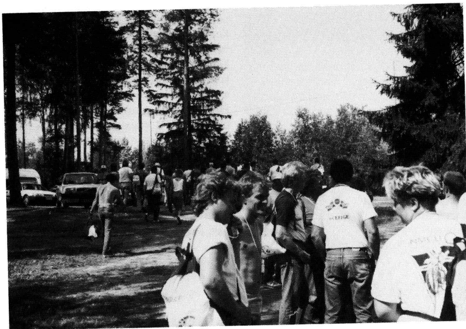
Karvion kanavalla koettiin tukkilaisromantiikkaa.